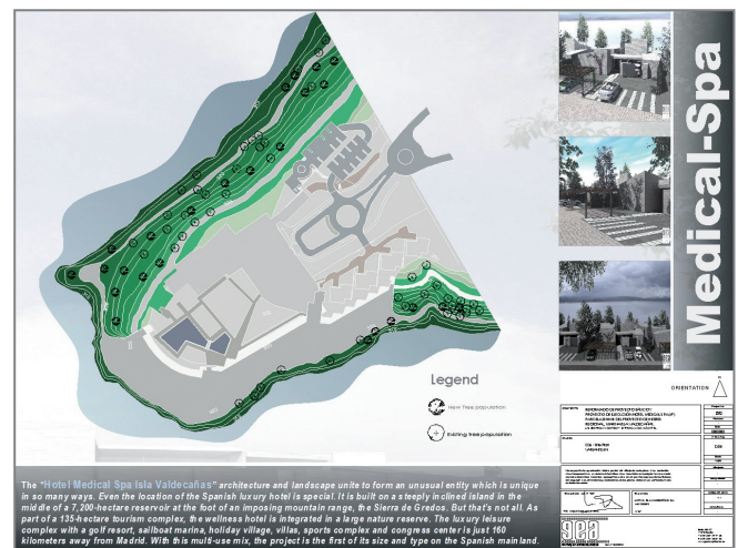
Prezentari 2D, Hotel Medical Spa Isla in Valdecañas, Spania, arhitect Miguelangel Gea & Asociados-Arquitectos, Sevilla